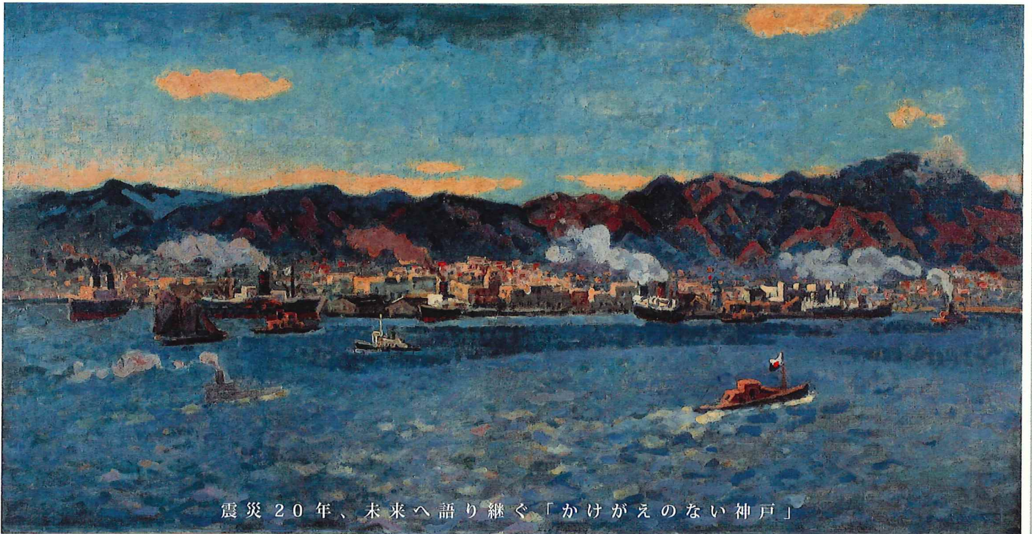
震災20年、未来へ語り継ぐ「かけがえのない神戸」

2015 1.17 sat. - 3.22 sun. 会期中一部展示替えあり [前期~2.11、後期2.13~]