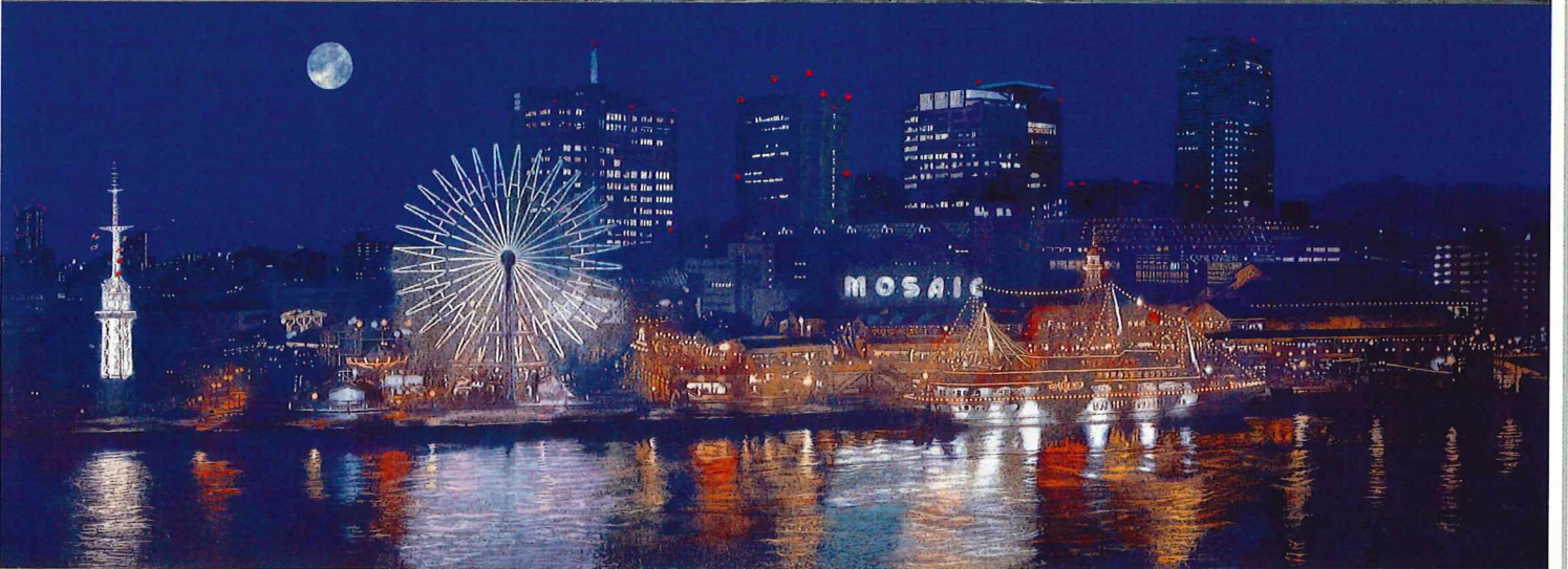
上 小見寺八山「神戸港図」1934年 油彩・キャンバス 神戸市立博物館蔵 下 西田眞人「輝く街」1999年 紙本着色 当館蔵