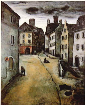
《樓まう(B)》1977年 油彩・キャンバス 当館蔵