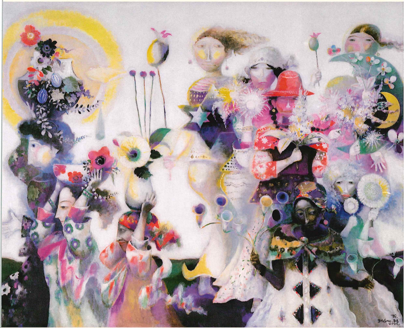
《花神湧遊》1996年 油彩・キャンバス 当館蔵