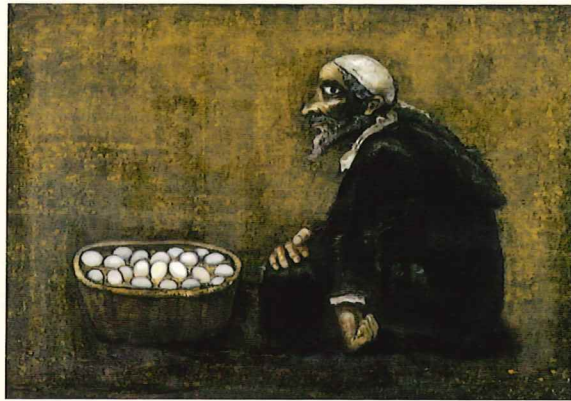
《卵と老人》1975年 油彩・キャンバス 当館蔵