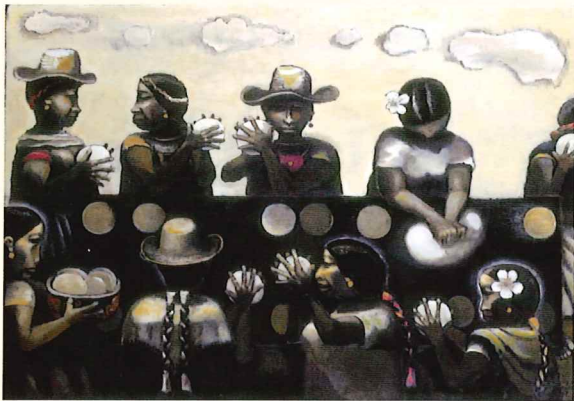
《樓まう(トルティーヤを作る女達)》1980年 油彩・キャンバス 当館蔵