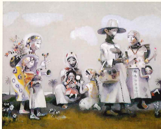
《聖なる日々の為に》2003年 油彩・キャンバス 当館蔵