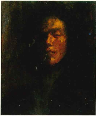
《自画像》1948年 油彩・キャンバス 当館蔵