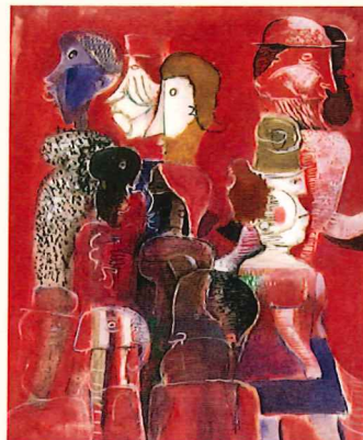
《ブロードウェイの人々》1967年 油彩・キャンバス 当館蔵