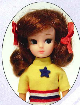
初代リカちゃん人形 1967年

少女漫画家 牧美也子氏(1935)は神戸市の出身です。手塚治虫のテキスト『漫画大学』を手引きに漫画を描き、21歳でデビューしました。少女漫画誌『りぼん』に連載されたバレエ漫画『マキの口笛』(1960〜63年)や、『銀のかげろう』(1968〜69年)等、輝く瞳を持つ少女