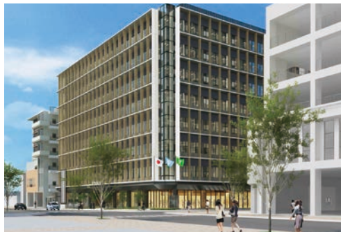
平成31年度完成予定の県市合同庁舎周辺にも緑を増やしていく

「長田区は実は9区で一番緑が少ないんだ。特に南部。長田区北部にある獅子ヶ池って知ってる？とても自然豊かな池で、今も地域の人が保全活動されている。南部地域の方がそこで一緒に苗木を育て、成木に育ったら南部に植える。でも、ただ持って帰って植えるだけじゃだめなんだ。例えば、何かの記念植樹として植えることで、愛着が生まれ、みんなが樹を見守っていく。そうしたら、南部にも緑が増えるし、南北の地域の交流も生まれると思うんだ。」