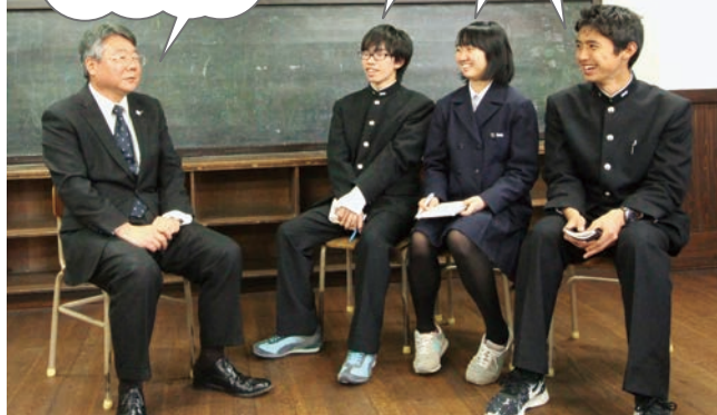
インタビュー場所「ふたば学舎」(二葉町)