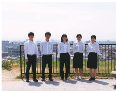
▲令和2年度インターンシップ生のみなさん

長田区役所では8月に3日間、5人のインターンシップ生を受け入れました。各課の概要説明や業務体験、まちあるき、若手職員との座談会等のプログラムを行いました。まちづくり課では、映画「思い、思われ、ふり、ふられ」のロケ地に行き、映画のワンシーンの再現写真を撮り区内ロケ地のPRをしました。再現写真は区の公式Instagramに掲載しています。ぜひご覧ください。