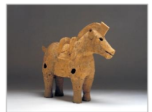
うまがた 馬形はにわ

東灘区の J R 住吉駅のまわりに広がる住吉宮町遺跡は、弥生時代から中世までさまざまな時代の建物跡や古墳（昔の人のお墓）が残る遺跡です。6世紀ごろの水害などによって深くもれていたので、昭和60年(1985)まで見つかることはありませんでした。古墳は、土をほってもり上げて「おか」のようにしたのですが、駅の東側にある住吉東古墳からは古墳の上になたてられた「人物はにわ」や「馬形はにわ」なども見つかっていて、これらは実際に西区にある神戸市埋蔵文化財センターで見ることができます。最近では、令和4年(2022)に調査が行われ、新しく古墳が7基見つかったそうです。J R 住吉駅のあたりには、まだうまったままの古墳がたくさんあります。いつも歩いている場所やおうちの下にも遺跡やはにわがねむっているかもしれませんね。