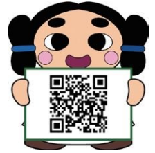
▲特設ページはこちら

日▶垂水区内のスポットを巡ってスタンプを集めよう!スタンプを14個中5個以上獲得された方には抽選で素敵な賞品をプレゼントします。 日▶9月1日(金)~12月27日(水) 日▶スマートフォン(二次元コード読取・インターネット接続が可能なもの) 日▶市総合コールセンター