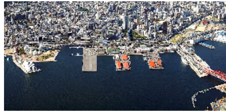
臨海部の遊休地の事例