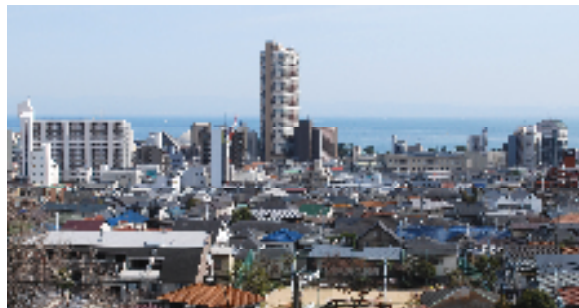
幹線道路沿いに、超高層マンション等が立地している事例