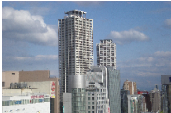
商業系用途地域に、超高層マンション等が立地している事例