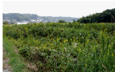
耕作放棄地の事例