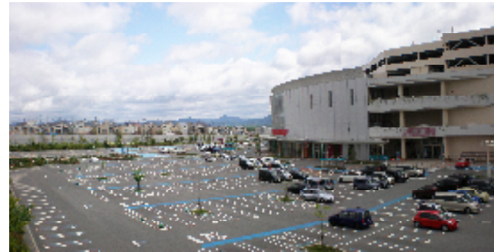
郊外のニュータウンに、大規模な集客施設と低層住宅が隣接して立地している事例