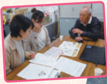
星和台連合自治会長に取材