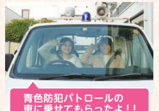
青色防犯パトロールの車に乗せてもらったよ!!