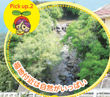
Pick up.2 福地付近は自然がいっぱい