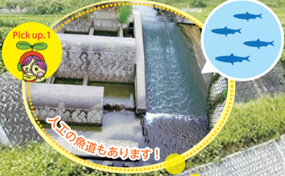
Pick up.1 人工の魚道もあります!