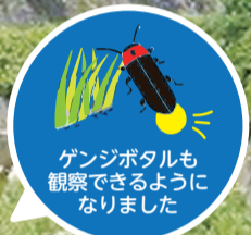
ゲンジボタルも観察できるようになりました