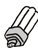
コンパクト型蛍光管