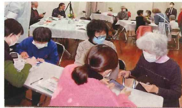
シニア向けスマホ教室