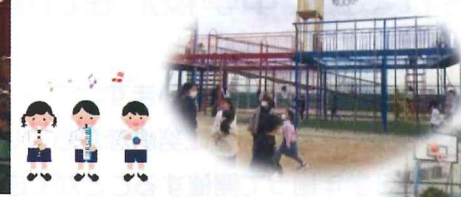
エンジョイタイム