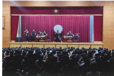
和太鼓コンサート