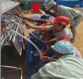
いつでもじゃぐち

地域の皆様、いつも美野丘小学校の子供たちを温かく見守っていただき、感謝しております。 今年度も地域の方々のご協力を得て、たくさんの行事を行うことができました。 子供たちも日頃体験できないイベントを楽しむことができ、笑顔いっぱいです。