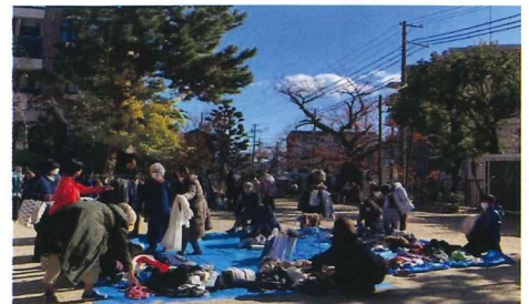
たすけあいバザー