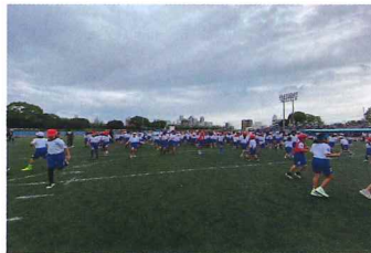
スポーツフェスティバル