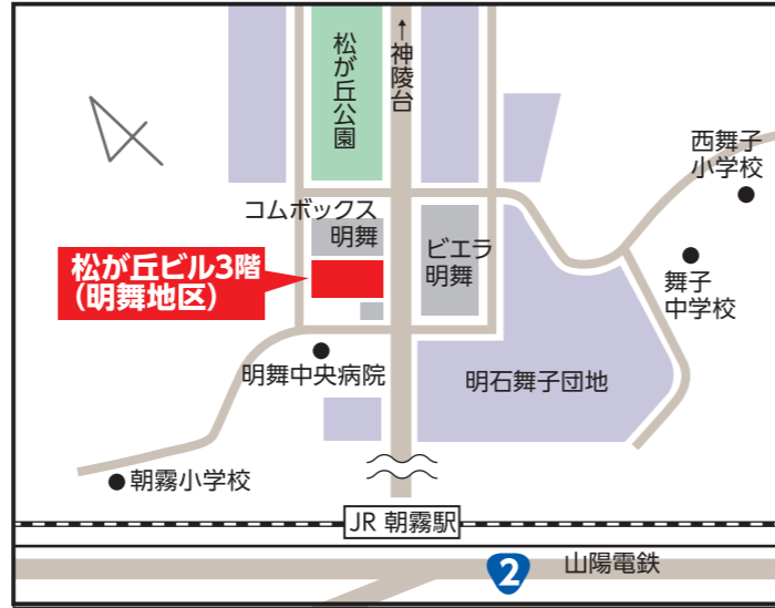
松が丘ビル3階(明舞地区) 【明石市松が丘2-3-7】