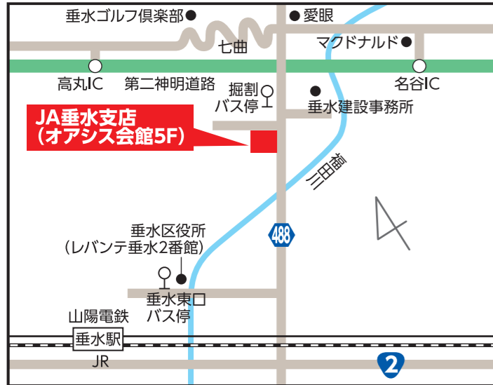
JA垂水支店(オアシス会館5階) 【垂水区向陽3-1-27】