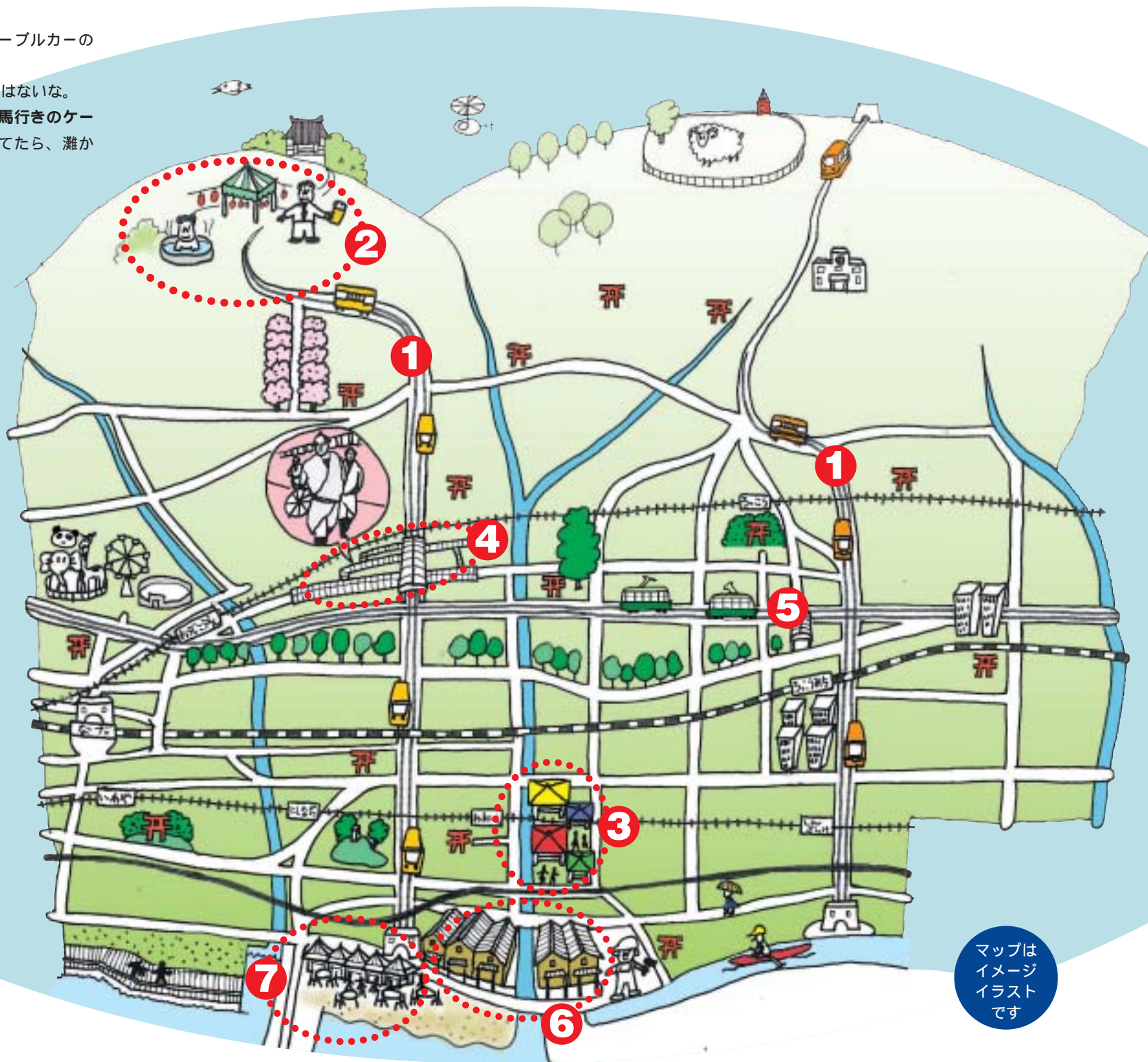
マップはイメージイラストです

灘埠頭のあたりも空き地が多いね。ケーブルカー走らせるんやったら、サンフランシスコみたいに、フィッシャーメンズワーフとかあつたらおもしろいんちゃうか？魚介類が食べられる屋台村があつたり。元々、灘区は漁業も盛んやったし。「とれとれのでてかむいわし〜」やからな(笑)(裏面「もしも灘区に...u」参照) あの辺、今でも結構魚が釣れるねんで。イワシ、タチウオ、イカ、ワタリガニ...あ、そういやマンボウも来たな。江戸前ならぬ「灘前」の魚ですか。灘前専門の回転寿司とか。それと都賀川河口に小さくてもいいから砂浜が欲しいねえ。あと、新在家運河あたりでカヤックとかできませんかね？あそこは魚も多いからおもしろいかもな。