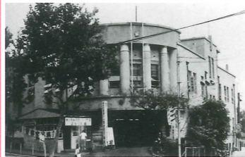
旧灘警察署庁舎（現存せず） 竣工：昭和9年 場所：岸地通1 灘区民ホールの場所にあった庁舎