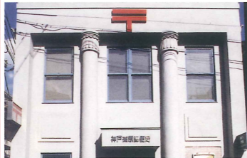
神戸篠原郵便局 竣工：昭和初期（推定） 場所：篠原中町3 正面の2本の柱がクラシックな建物