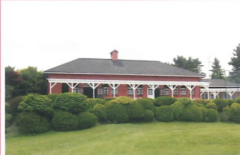
神戸ゴルフ倶楽部・クラブハウス 竣工：昭和7年 場所：六甲山町 日本最古のゴルフ場のクラブハウス