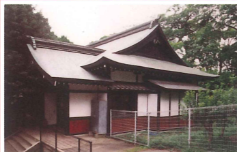
王子動物園・杜の館 竣工：昭和初期（推定） 場所：王子町3 王子神社の社務所が無料休憩所に