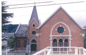
神戸文学館 竣工：明治37年 場所：王子町3 元はここにあった関西学院のチャペル