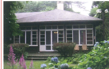
ヴォーリス六甲山荘 竣工：昭和9年 場所：六甲山町（普段は非公開） 室内から花を楽しめる山荘