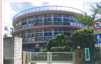
美野丘小学校校舎 竣工：昭和32年 場所：箕岡通1 今では珍しい円形校舎

今回のなだだなで登場した灘の古建築たち。まだまだ古い建物もあります。皆さんの中で灘区内の古い建物にまつわる思い出や、古い写真などがありましたら「なだだな」までご一報ください。 〒657-8570 灘区役所まちづくり課内「なだだな」係（住所不要）