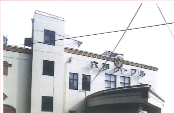
六甲ケーブル・六甲山上駅 竣工：昭和7年 場所：六甲山町 壁のライオンの飾りがレトロな駅