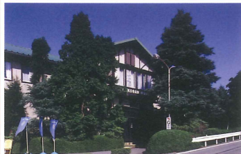
六甲山ホテル旧館 竣工：昭和4年 場所：六甲山町 昭和初期リゾートホテルの香りが漂う