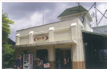
摩耶ケーブル・虹の駅 竣工：大正14年 場所：上野字小屋場三の休原 大正の面影を残す市内有数の古い駅舎