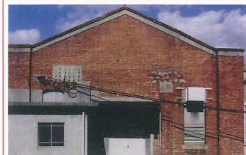
阪急電鉄六甲変電所 竣工：大正9年（推定） 場所：宮山町2 歴史を経た貴重な赤煉瓦の外観