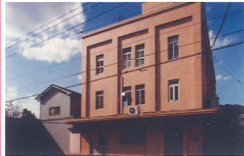
鈴木薄荷事務所 竣工：昭和初期（推定） 場所：下河原通1 まちなかのレトロな事務所ビル