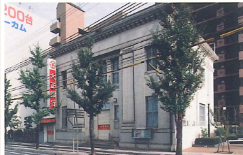
大正銀行灘支店（現存せず） 竣工：昭和11年 場所：鹿ノ下通3 神戸市内現役最古の銀行建築だった