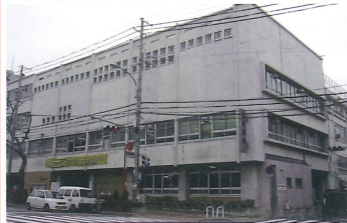
旧灘区総合庁舎 竣工：昭和34年 場所：神ノ木3 神戸市最初の総合庁舎