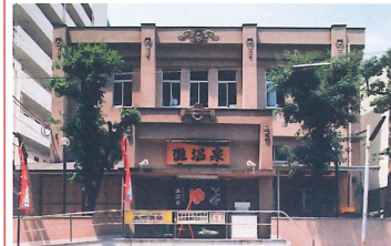
灘温泉六甲道店 竣工：昭和7年 場所：備後町3 入り口の扉は昔の靴箱を利用