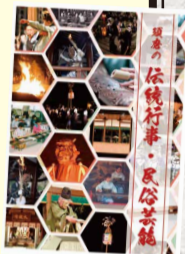
冊子『須磨の伝統 行事・民俗芸能』