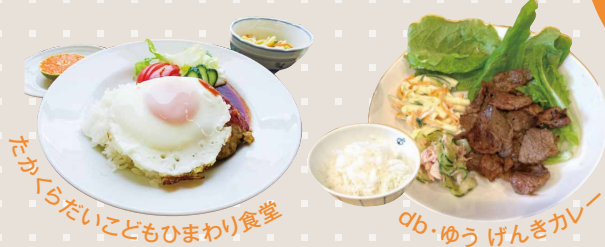
たかくらだいこどもひまわり食堂

地域の方やおともだちと一緒に食事をしたり、リラックスしたりして過ごせる場所です。地域の方が作った温かい食事が食べられます。