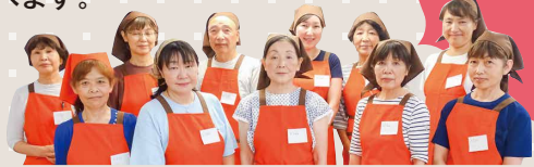
神の谷こども給食 (㊦こども食堂 / ㊧遊び場)

運営者の声 民生委員児童委員を中心に年に2回活動しています。子どもたちの声を聞きながらイベントやメニューを計画しています。