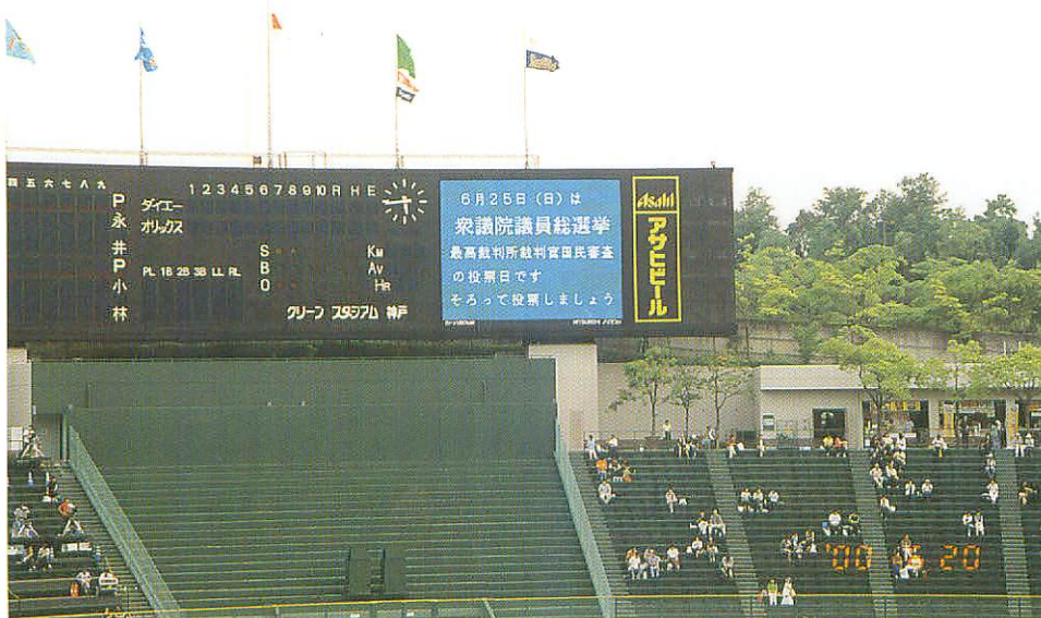
グリーンスタジアム オーロラビジョン