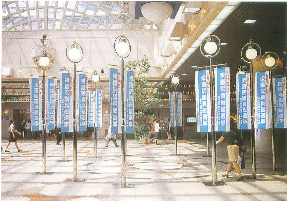
デュオこうべペナント