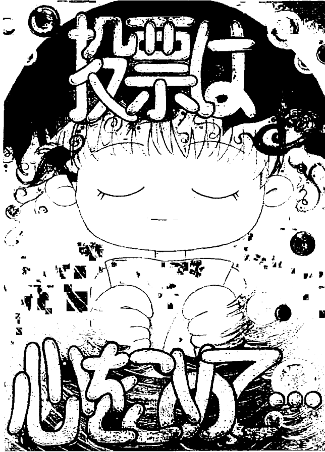
平成11年度明るい選挙をすすめるポスターコンクール特選 県立兵庫工業高校2年 森山 浩代さんの作品