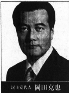
民主党代表 岡田克也