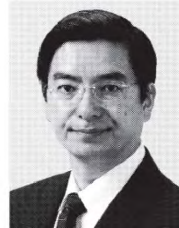
やまもと 山本 ひろし 現 党参院副幹事長。慶應義塾大学卒。参院議員1期、58歳。どこまでも人間主義。