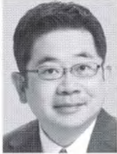
前参議院議員 小池晃 1960年東京都世田谷区生まれ。東北大学医学部卒。参院2期。党副委員長・政策委員長。医師。