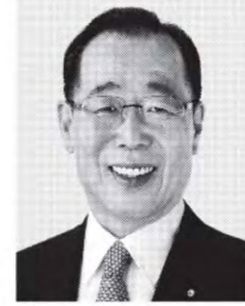
うお ずみ 魚住 ゆういちろう 現 弁護士、防災士。元総務副大臣。参院議員3期。東京大学卒、60歳。まっすぐ、政策実現!