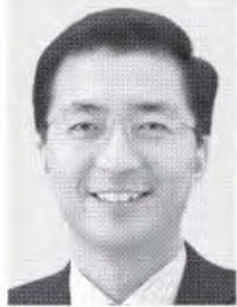
参議院議員 山下よしき 1960年香川県生まれ。鳥取大学卒。95年に参院大阪選挙区で初当選、07年比例代表で再選。党書記局長代行。