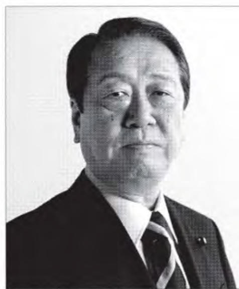
生活の党代表 小沢 一郎