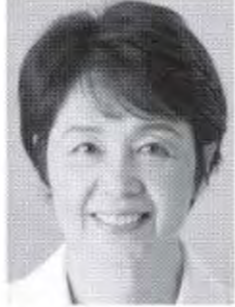
参議院議員 紙智子 1955年札幌市生まれ。北海道女子短期大学卒。参院2期。党常任幹事会委員・党農林・漁民局長。