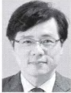
参議院議員 井上さとし 1958年山口県生まれ。広島市に育つ。京都大学卒。参院2期。党参院幹事長・参院国対委員長、党中央委員。