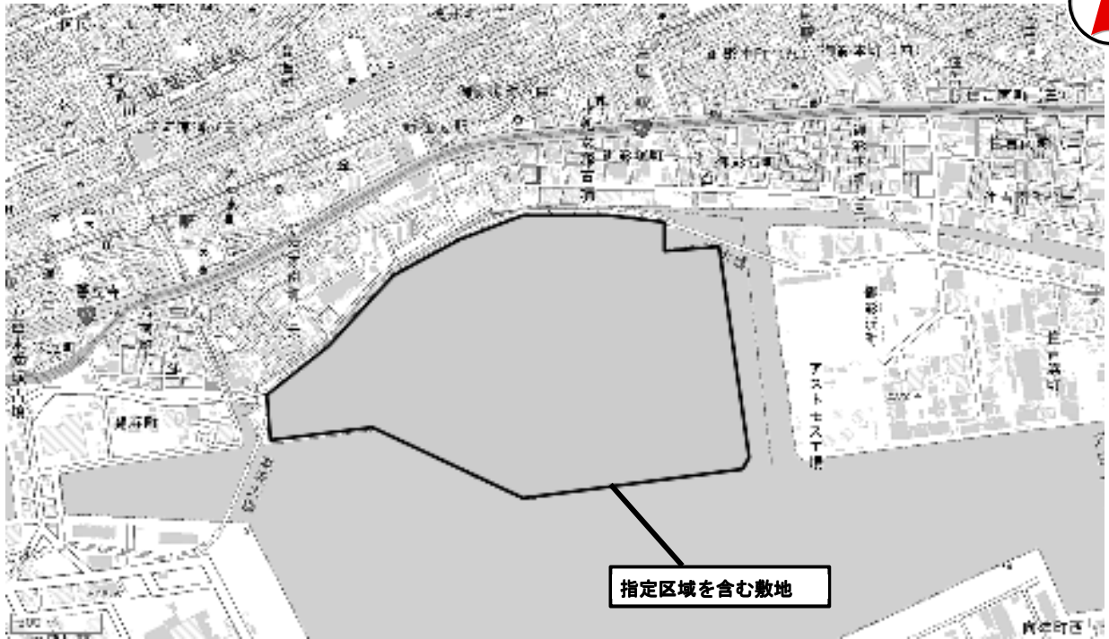
この地図は、国土地理院の地理院地図（電子国土 Web）に追記したものである