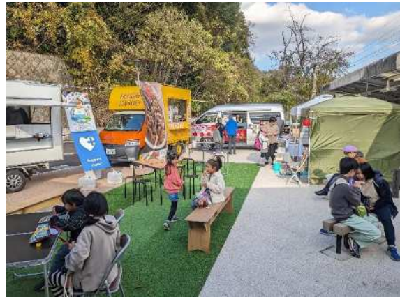
駅前広場を活用したイベント（花山駅）