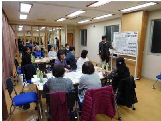
専門家を交えた会議の状況