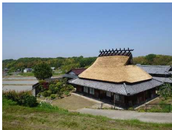
茅葺民家（指定景観資源 北区淡河町）