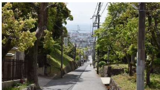
城の下通 地獄坂（灘区）