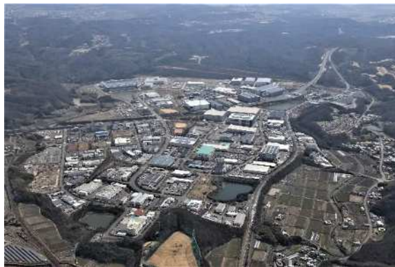
神戸複合産業団地（北西側から）