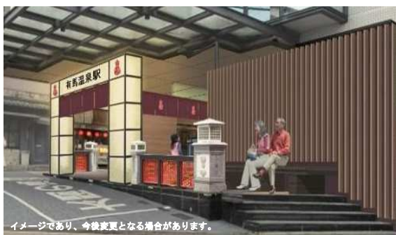
イメージであり、今後変更となる場合があります。