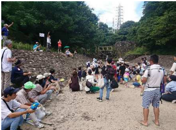
まちづくり団体の活動状況（まち歩き）