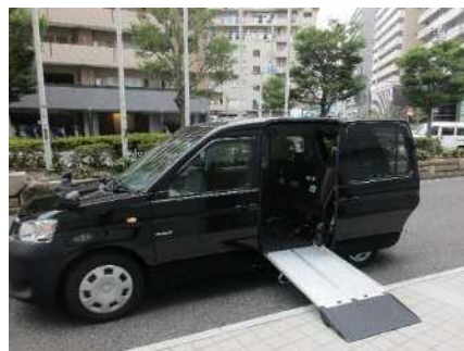
ユニバーサルデザインタクシー