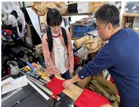
起業家支援（地元事業者との連携の様子）