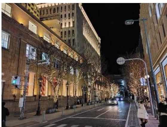
夜間景観形成整備（旧居留地）