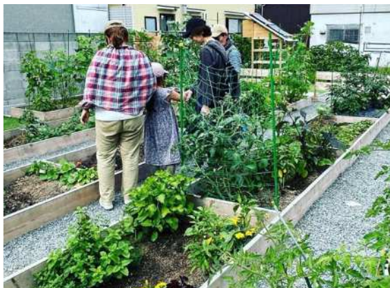
空き地の農地活用事例（長田区内）