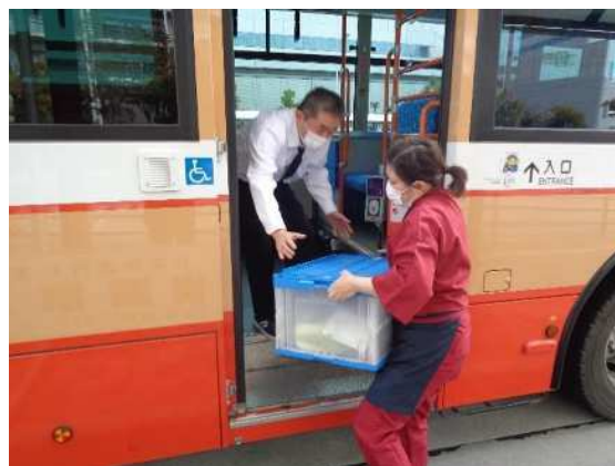
路線バスを活用した移動販売