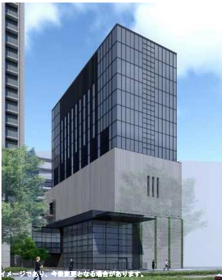
(仮称)連絡ロビー・エネルギー施設 (イメージ)