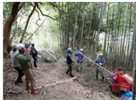
多井畑西地区における取組み（交流広場プレーパーク、市民グループによる竹林整備活動）