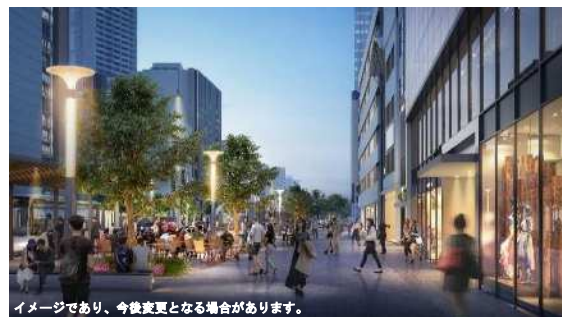
センター街東口周辺（イメージ）