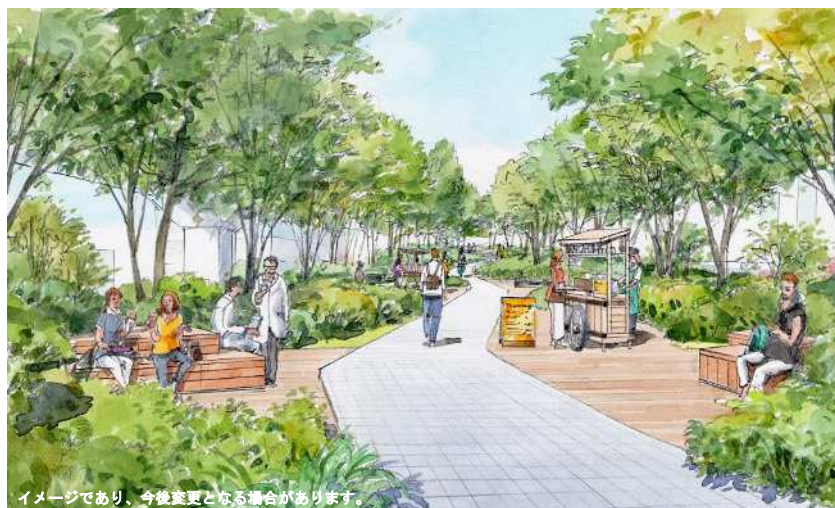
ポートアイランド第2期中央緑地軸の再整備（イメージ）