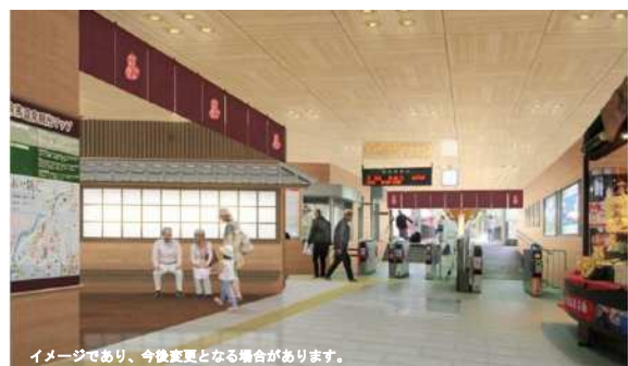
イメージであり、今後変更となる場合があります。