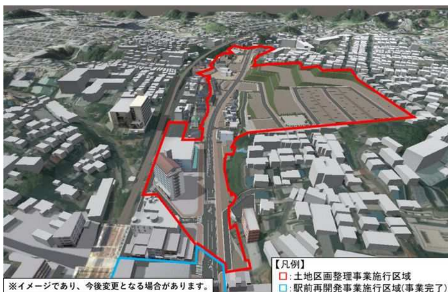
鈴蘭台駅北地区土地区画整理事業（イメージ）