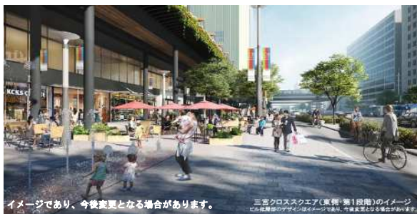
三宮クロススクエア（第1段階）イメージ