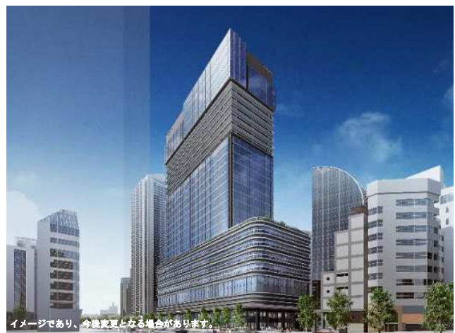
本庁舎2号館再整備事業 (イメージ)