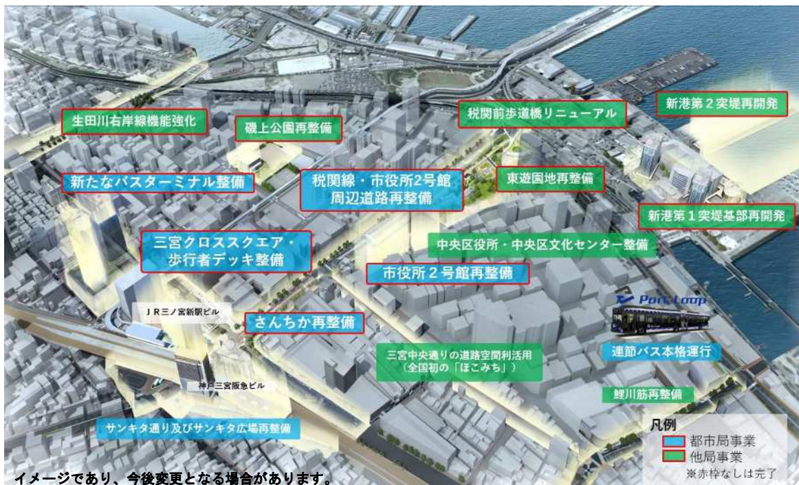
都心・三宮の再整備

神戸の都心の活性化と魅力的で風格ある都市空間の実現に向け、神戸の都心の未来の姿〔将来ビジョン〕及び三宮周辺地区の『再整備基本構想』に基づき、着実に具体的な取組みを進める。