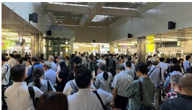
神戸新交通三宮駅の朝ラッシュ時における混雑状況(令和5年9月)