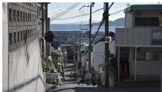
歌敷山 路地（垂水区）