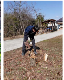
薪割りはくさびを使って