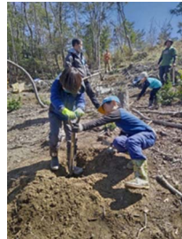
根が伸びやすいよう土をほぐします

12~1月に伐採したコナラを割りました。節が多いため木材が堅く、なかなかの重労働に…。