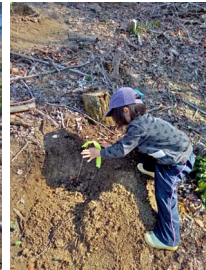
土を被せて目印を付けて完了