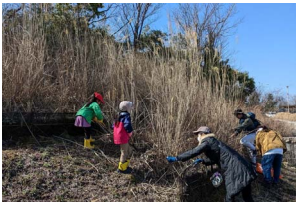
根元近くで刈り取り

南側の駐車場入り口法面のススキを刈り取り。刈り取ったススキのうち、状態の良いものを束ねて保管。