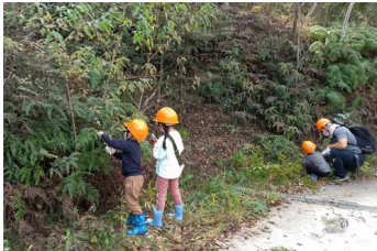
園路沿いのウラジロ刈り

里山でよくみられる植物を観察でき、四季の移ろいを感じられる道になるよう、残したい植物のまわりや道沿いの木の伐採やササやシダを刈り取りました。