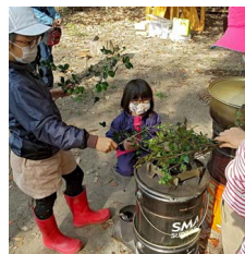
ヒサカキ茶の準備