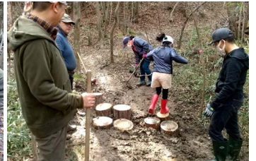
ちゃんと渡れるかな？