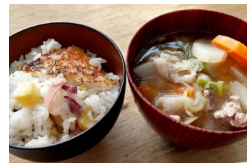
どっちもおいしい！