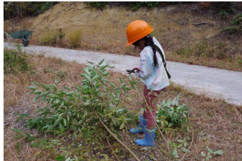
伐った木は細かくします