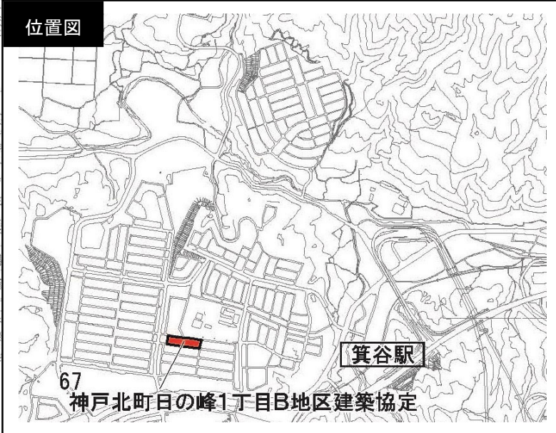
67 神戸北町日の峰1丁目B地区建築協定