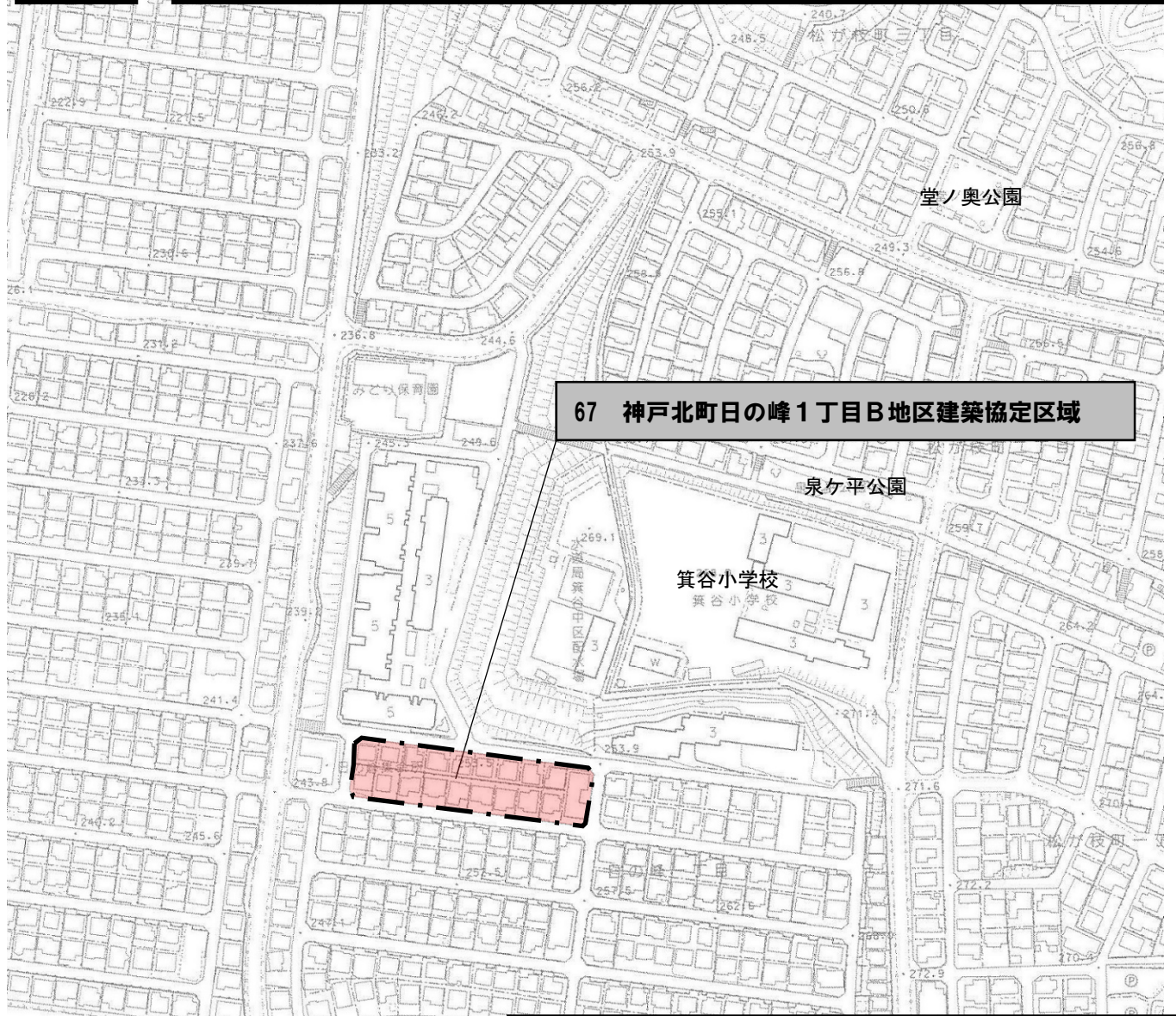
67 神戸北町日の峰1丁目B地区建築協定区域