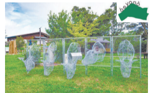
2023(令和5)年度ビジターセンター設置作品