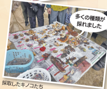
採取したキノコたち