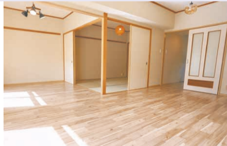
リノベーション住宅の一例。