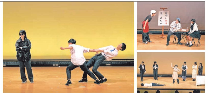
出演はもちろん、演出や美術、衣装も生徒が担当。全員で作品を仕上げます。

兵庫県高等学校演劇研究会西播支部(県立姫路南高校) 079-236-1835 079-236-3186