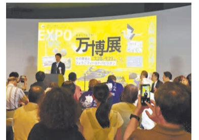
企画展の開会式の様子。