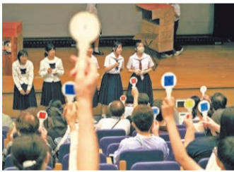
挙げられた札の点数を運営校の生徒が集計します。

同バトルは春から初夏にかけての稽古の成果発表の場として、兵庫県高等学校演劇研究会西播支部の呼びかけで2013(平成25)年に始まりました。審査するのは