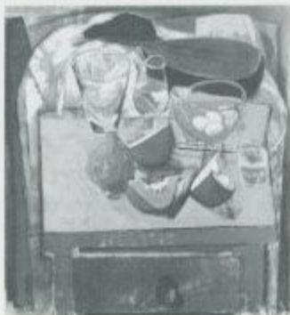
小磯良平「かぼちの果物静物」 1957年 油彩・キャンバス 98.8×91.0cm

小磯アトリエ(当館中庭に移築・復元)から生まれていった作品の数々をお楽しみください。