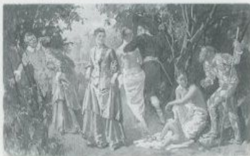
小磯良平「群」 1955-74年 油彩・キャンバス 99.7×145.7cm