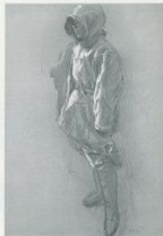
小磯良平「男」 1952年 パステル、水彩・紙 53.6×45.6cm