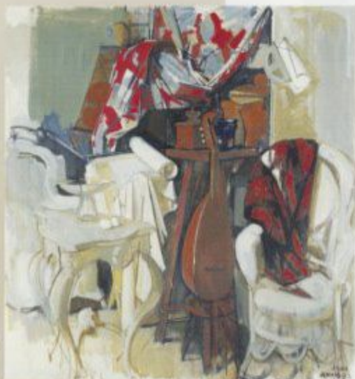
小磯良平【ソファのあそび】 1966年 油彩・キャンバス