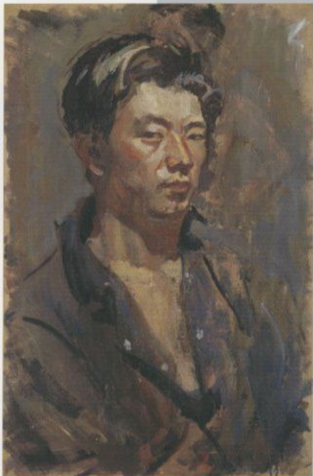
小磯良平【自画像】 1926年 油彩・キャンバス