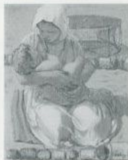
小磯良平「母子像」 1953年 油彩・キャンバス 91.2×72.9cm