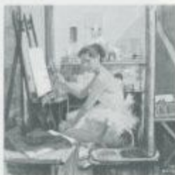
小磯良平「室内のバルコニー」 1967年 油彩・キャンバス 90.7×90.8cm