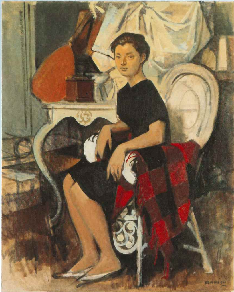
小磯良平「踊り子」1940年頃 油彩 小磯良平「室内全景」1967年 油彩