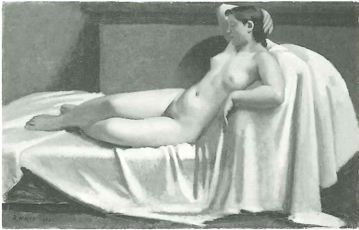
小磯良平「横たわる裸婦」1931年 油彩・キャンバス 73.1×116.8cm