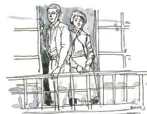
小磯良平「人間の壁」挿絵原画 第307回 1966年 イ・ク、水彩