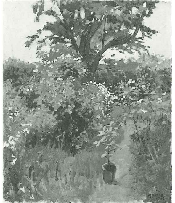
小磯良平「庭」1963年 油彩・キャンバス 72.6×60.8cm