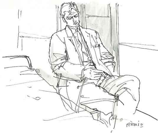
小磯良平「人間の壁」第521回 1959年 インク、水彩・紙 19.0×29.9cm