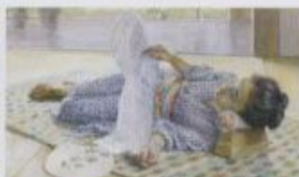
和田英作《少女を慰む》1907(明治30)年 東京美術学校