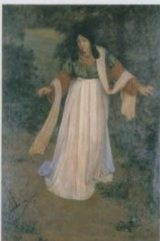
和田英作《ちのねこい(次通絵)》1905(明治36)年 株式会社聖徳堂蔵