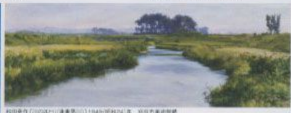
和田英作《1903(明治36)年(鎌倉)》1949(昭和24)年 刈谷市美術館蔵