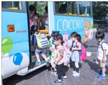
<ステーションでバスに乗車>