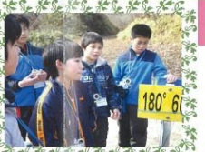
オリエンテーリング