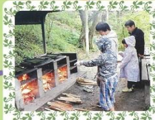
キャビン炊さん場

芝生の上で遊んだり、ジャンボスライダーをすべったりいろんな楽しみ方で自然を感じて下さい。