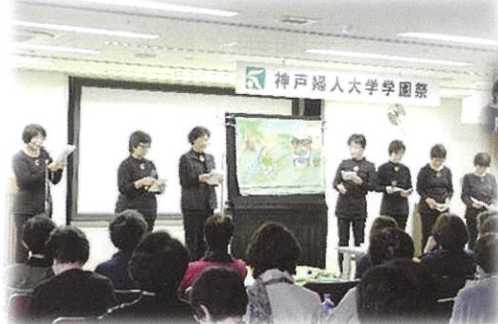
〈ふくろうの布絵芝居〉