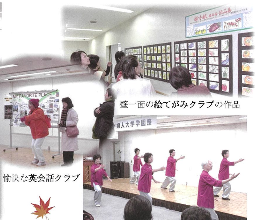
壁一面の絵てがみクラブの作品