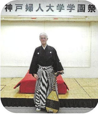
神戸婦人大学学園祭