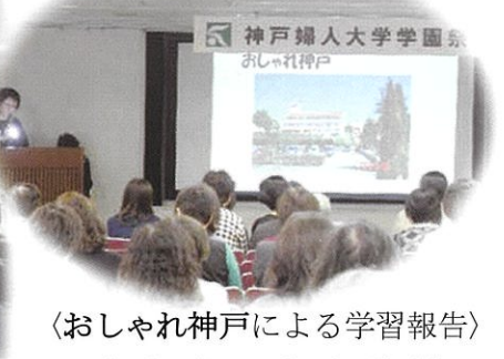
〈おしけれ神戸による学習報告〉