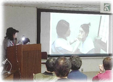
〈Cosme 12 による実習風景〉