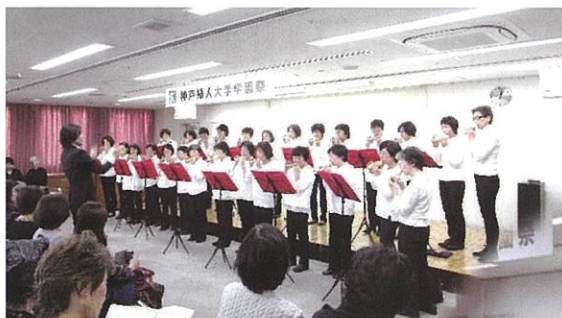
壮観のオカリナクラブの演奏