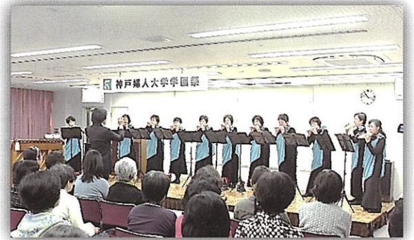
〈ピアチェーネ・オカリナクラブの演奏〉