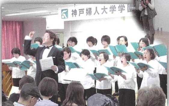
コーラスクラブ♪みんなで歌おう♪