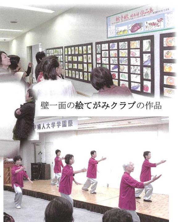
優雅に舞う太極拳クラブ