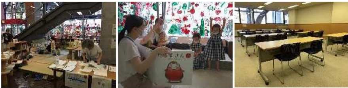
[写真 | 実験イベントの様子]

ネットモニターアンケートや近隣住民アンケート、現地での実験イベント(こども図書コーナーおよび中高生のための自習室)等を通じて市民の皆様から頂いた意見に加え、地域住民等で構成する検討会で委員の皆様から頂いた意見を踏まえ課題の抽出および具体的な見直し策について検討を行なった。検討会については、多角的な視点で検討するため、地域関係者、教育関係者、行政等で検討委員を構成する「神戸アートビレッジセンター地域活性化機能検討会」を発足し、令和3年4月から10月にかけて6回開催した。