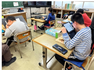
調べ学習（生活単元学習） 《中学部》