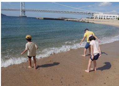
校外学習（強歩会） 《幼小学部》