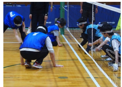
スポーツ大会の一場面 《高等部》