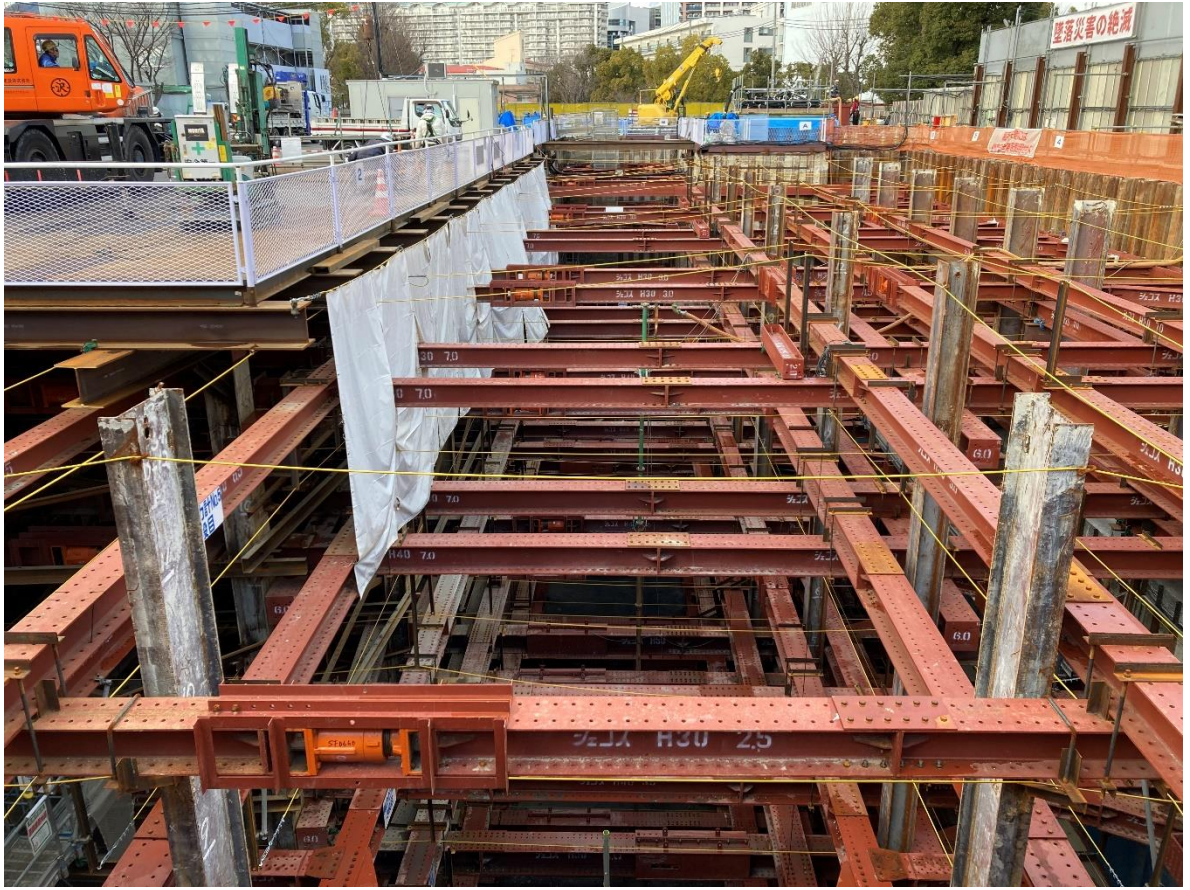
④雨水幹線工事のためのシールドマシンを組立中