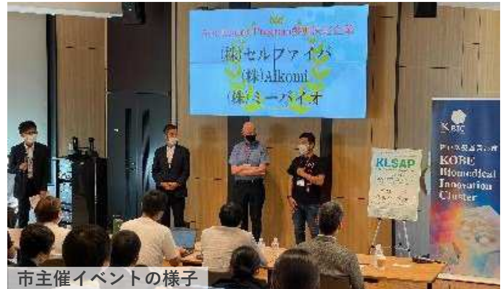
市主催イベントの様子