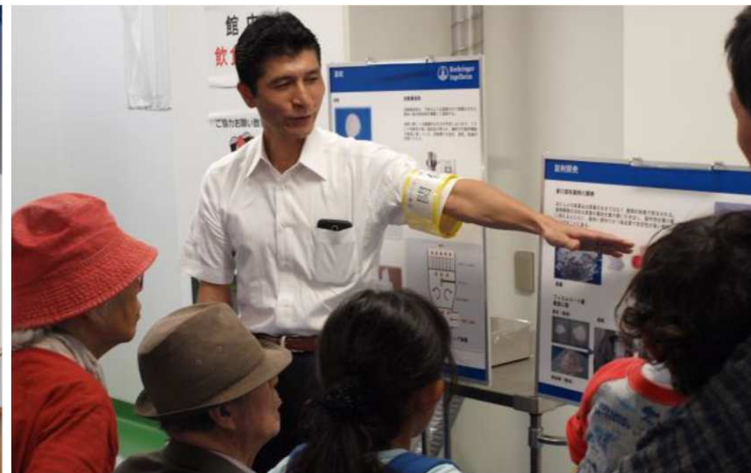
※研究所市民公開の様子