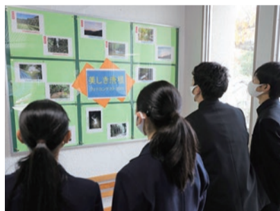
▲ コンテスト入賞作品はパネルにて掲示！

少子高齢化が進む唐櫃地域では、誰もが暮らしやすいまちづくりをめざすため、唐櫃の将来像を描き、実現するための準備会が立ち上がっています。準備会では、全住民アンケートの実施や、まちづくり勉強会を継続的に開催し、将来のより良いまちのあり方について考える「からとの未来を考える会」の設立をめざしています。