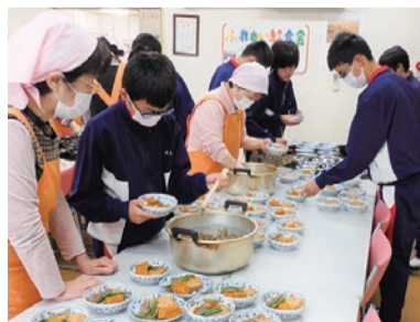
▲ 中学生も準備に参加！（2017年撮影）

そのほか、ふれあい喫茶や子育てサロン、パソコン教室なども実施しており、地域のみなさんの協力を得ながら、「憩いのある集いの場」を提供しています。