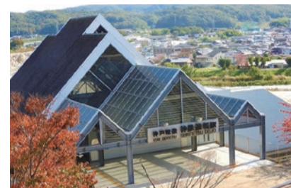
▲ 現在の神鉄道場駅