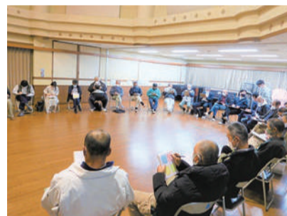
▲ 多くの提案があった検討部会

現在、八多町自治協議会では農村ツーリズムに取り組んでおり、令和3年3月には自転車や徒歩で地域をめぐるイベントが開催される予定です。今後の情報の詳細などについては、八多町のホームページにて、ぜひご確認ください。