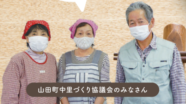
山田町中里づくり協議会のみなさん