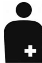
【オストメイト用設備／オストメイト】 所管：公益財団法人交通エコロジー・モビリティ財団