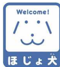
【ほじょ犬マーク】 所管：厚生労働省