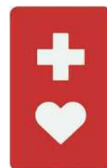
【ヘルプマーク】 所管：東京都