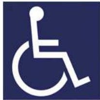
【障害者のための国際シンボルマーク】 所管：公益財団法人日本障害者リハビリテーション協会