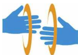
【手話マーク】 所管：一般財団法人全日本ろうあ連盟