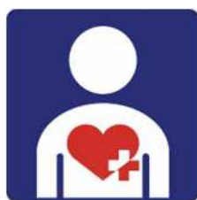
【ハート・プラスマーク】 所管：特定非営利活動法人ハート・プラスの会