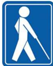
【盲人のための国際シンボルマーク】 所管：社会福祉法人日本盲人福祉委員会