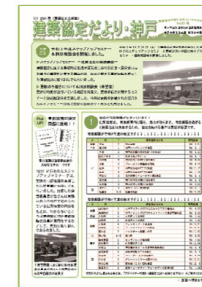
建築協定だより（年2回発行）