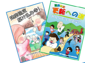
協定マンガの配布