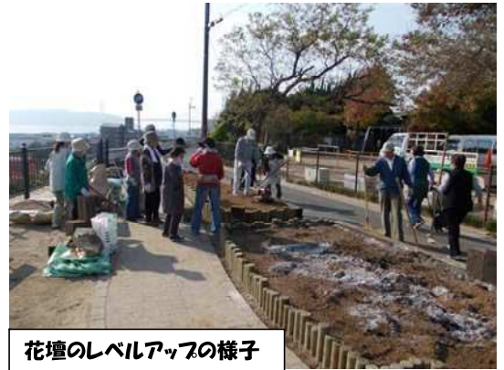
花壇のレベルアップの様子

開園当初から公園管理会により、公園の清掃や草刈、樹木の剪定など様々な活動を行っています。また、海側の入口にある市民花壇では、四季折々の花を育て、道行く方々の目を楽しませてくれます。昨年の11月には花と緑のまち推進センターと緑化クラブ KOBE の協力により花壇のレベルアップも実施しました。山陽電車の東垂水駅から歩いてすぐですので、ぜひ一度お越しください。