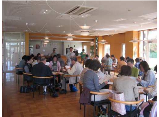
月 1 回の定例会の様子

神戸市建設局西建設事務所 西区玉津町今津字宮の西 333-1 Tel078-912-3782 e-mail:nishi-kensetsu@office.city.kobe.lg.jp