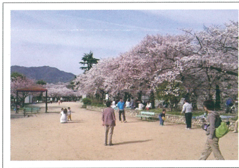
桜の季節の妙法寺川公園