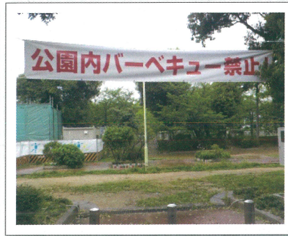
公園内に設置した横断幕