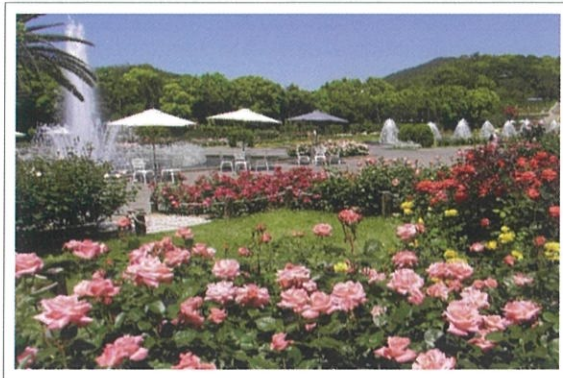
王侯貴族のバラ園

また、園内にはアスレチックコース「子供の森・冒険コース」や児童遊園もあり、ご家族連れで楽しい日をお過ごしいただけます。皆様のご来園をお待ちしております。