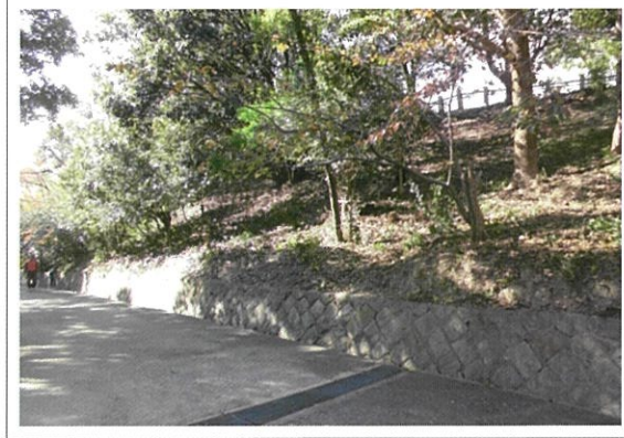
イベント後の園内。 雑木を伐採したことで明るくなりました。