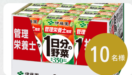
伊藤園1日分の野菜 紙パック200ml （12本入りハーフケース）