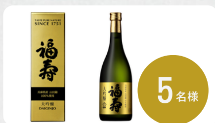
【化粧箱入】 神戸酒心館 福寿 大吟醸 （720ml）