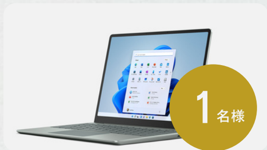
Surface Laptop Go 2