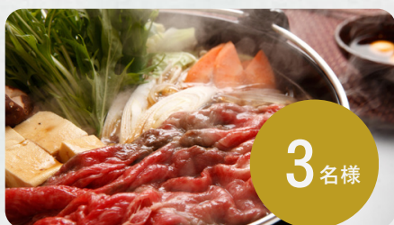
神戸元町辰屋の神戸牛 す き焼き肉 極上 ギフト 2~3人前（400g）