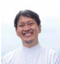
スーパーバイザー 中塚 雅也 神戸大学大学院農学研究科 教授