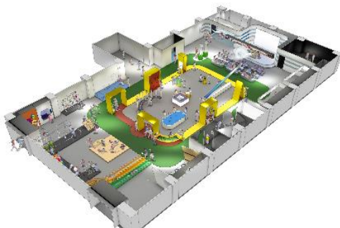
第6展示室 リニューアルイメージ