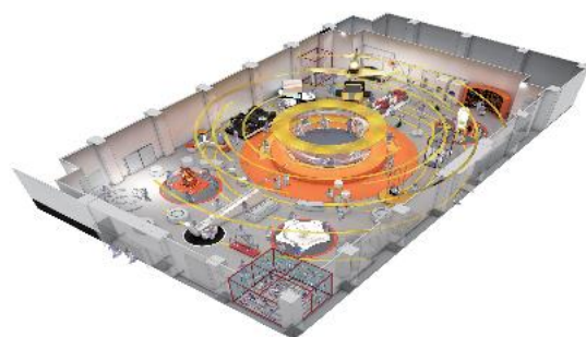
第1展示室 リニューアルイメージ