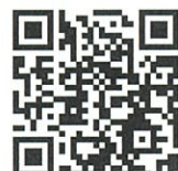
神戸市立市民福祉 スポーツセンター GoogleMAP