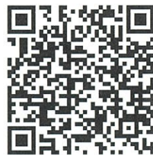
お申込みフォーム

●申込方法 右記のGoogleのイベントお申込みフォームに、必要事項【メールアドレス、ご参加される方(ご本人・ご家族)のお名前、ご本人・ごきょうだいのご年齢・学年、住所(市名のみ)、電話番号、小児慢性特定疾病名、イベントで体を動かすに当たって配慮が必要なこと(ある場合のみ記入)]をご記入ください。 申込完了後に、ご記入していただいたメールアドレス宛に申込内容が自動送信されます。