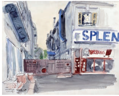
小松益喜《ラロシェル通り パリ14区 (RUE LAROCHELL PARIS, 14e)》1974年