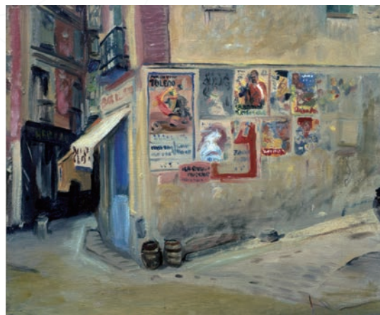
小松益喜《トレンドの街角にて》1958-59年頃 当館蔵