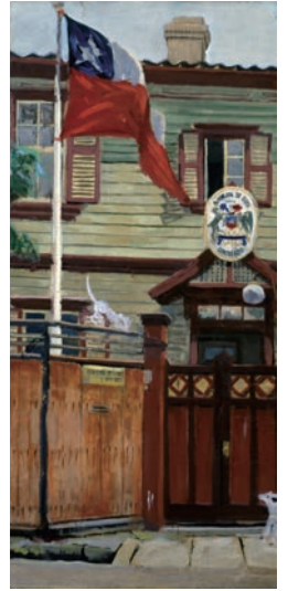
小松益喜《チリ領事館 (猫と犬)》制作年不詳