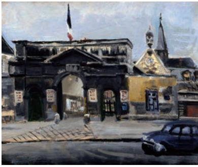
小松益喜《旗のある門》1958-59年頃