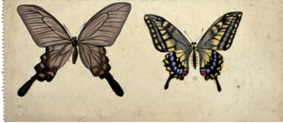
小松益喜《蝶》制作年不詳