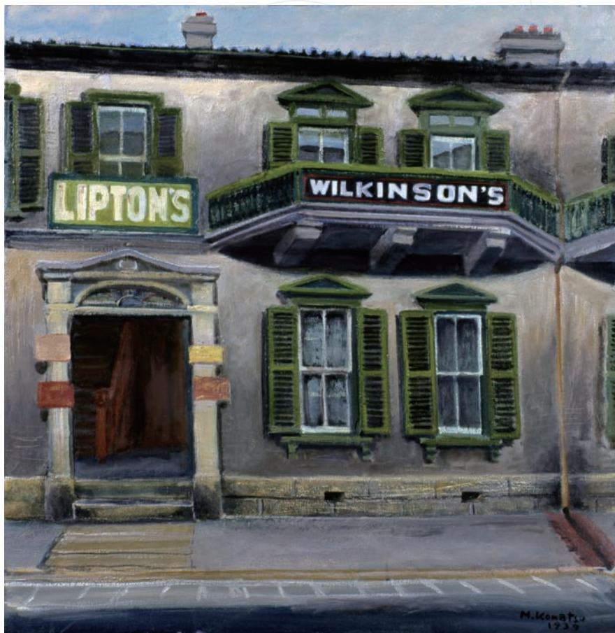
小松益喜《リプトンとウィルキンソン》1982-83年頃 当館蔵