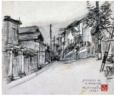
小松益喜《北野町風景 (PAYSAGE DE KITANOCHO)》1978年