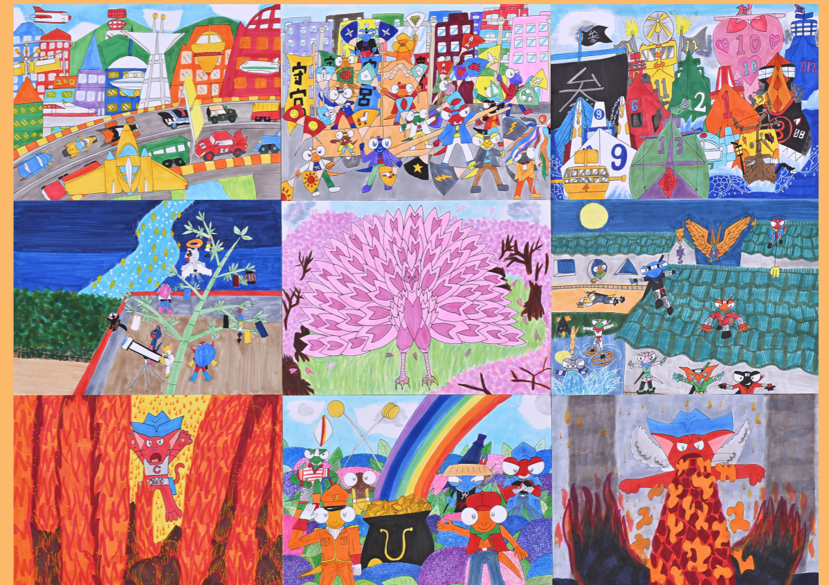
作品介绍:HUG+展2023最優秀 賞作品「オリジナルキャラクターの世界」作者:渡邊 賢志郎 (青陽東絵画教室)

神戸市内の障がい者を対象に絵画・書・写真・立体・その他の作品を公募し、応募いただいたすべての作品を展示します。みなさんのご応募をお待ちしています!