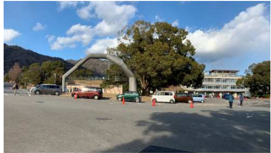
駐車場（スタジアムのエントランス前）