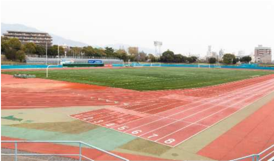
王子スタジアム陸上トラック