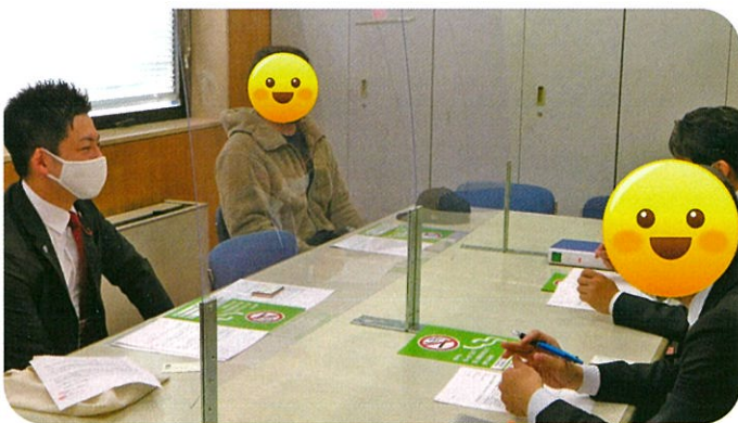
ポイ捨て防止重点区域化を求める要望書提出

神戸の子育て支援の中核施設であり、兵庫区和田岬に移転した「こべっこランド」。地元自治会や利用者の皆様より駐車場不足による多数の問題をお聞きしておりました。現在イオンモール神戸南駐車場の利用を案内していますが、小さい子どもを連れて歩ける距離ではありません。地元のお声をお伝えするとともに、市営和田岬駅前駐車場の駐車サービス再開による活用を求めました。